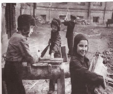
Работы-постеры за работу, 1941-1944 гг., Ленинград.

Все – и ученики, и учителя – поддерживали друг друга, не давая низринуться в бездну отчаяния. Только так – преодолевая каждый самого себя, но ощущая внутреннее единство – можно было выжить.